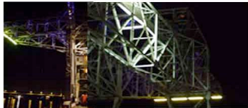
Pratiquer le lieu, sa machine de représentation