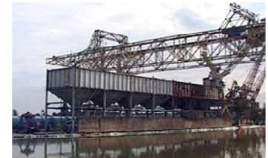
En amont du projet urbain