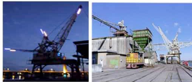
Site d'expérimentation Art, Architecture, Paysage