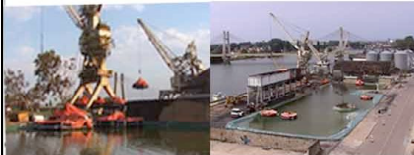
La ville regagne son fleuve