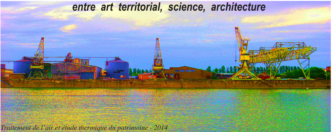
Traitement de l'air et étude thermique du patrimoine - 2014

entre art territorial, science, architecture