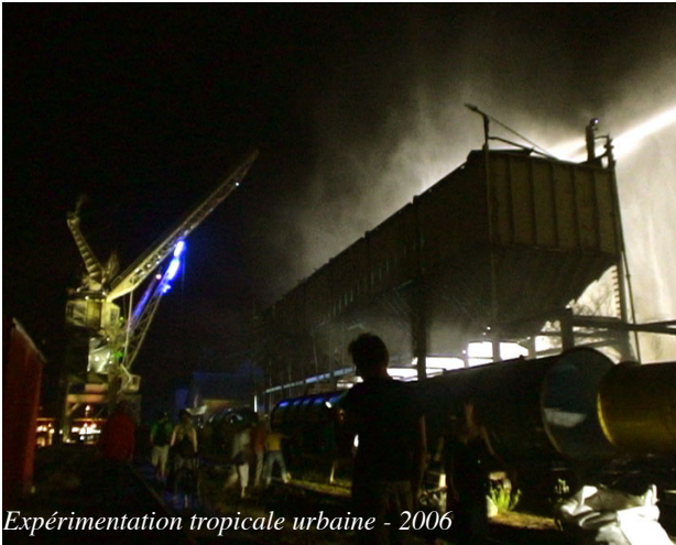
Expérimentation tropicale urbaine - 2006